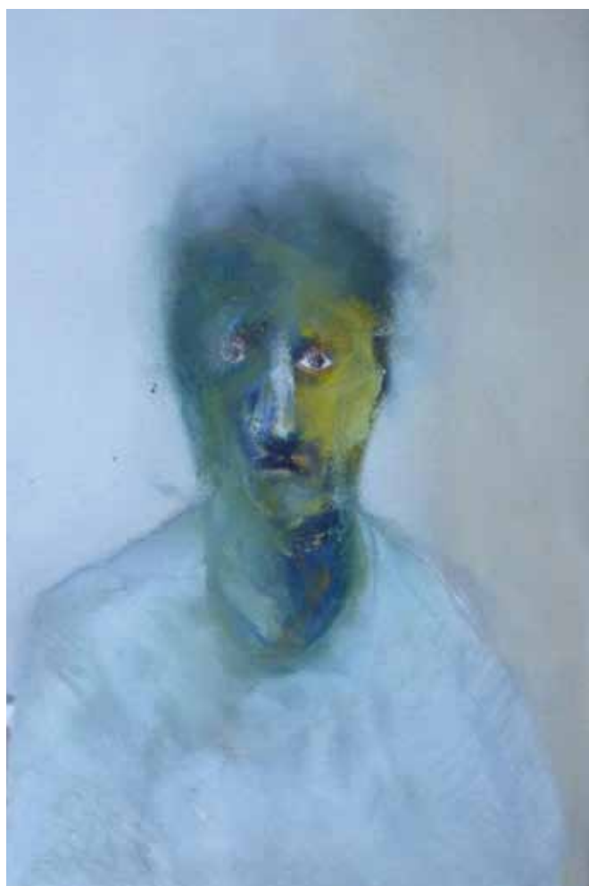
Régis Flandrin, série Regard huile sur papier